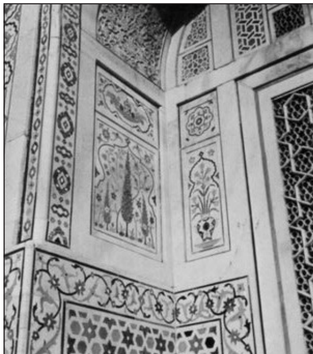
مسجد مسلمانان، التمدت ودوله، آگرا هند - تزئینات دیوار داخلی (۱۶۲۵)

گسترش مفهوم «شکل» بسیار دشوارتر از آموزش رنگ و الگو است. مفهوم کیفیت سه بعدی یک ساختمان از فضای اشغال شده آن و ارتباط این فضاها بایکدیگر مفهومی است که به ندرت درک شده است.